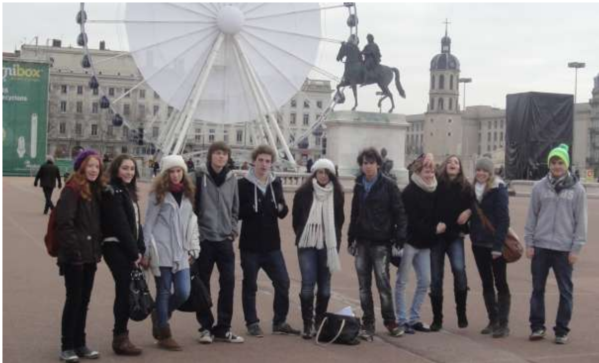
Weingartener Schülergruppe in Bron