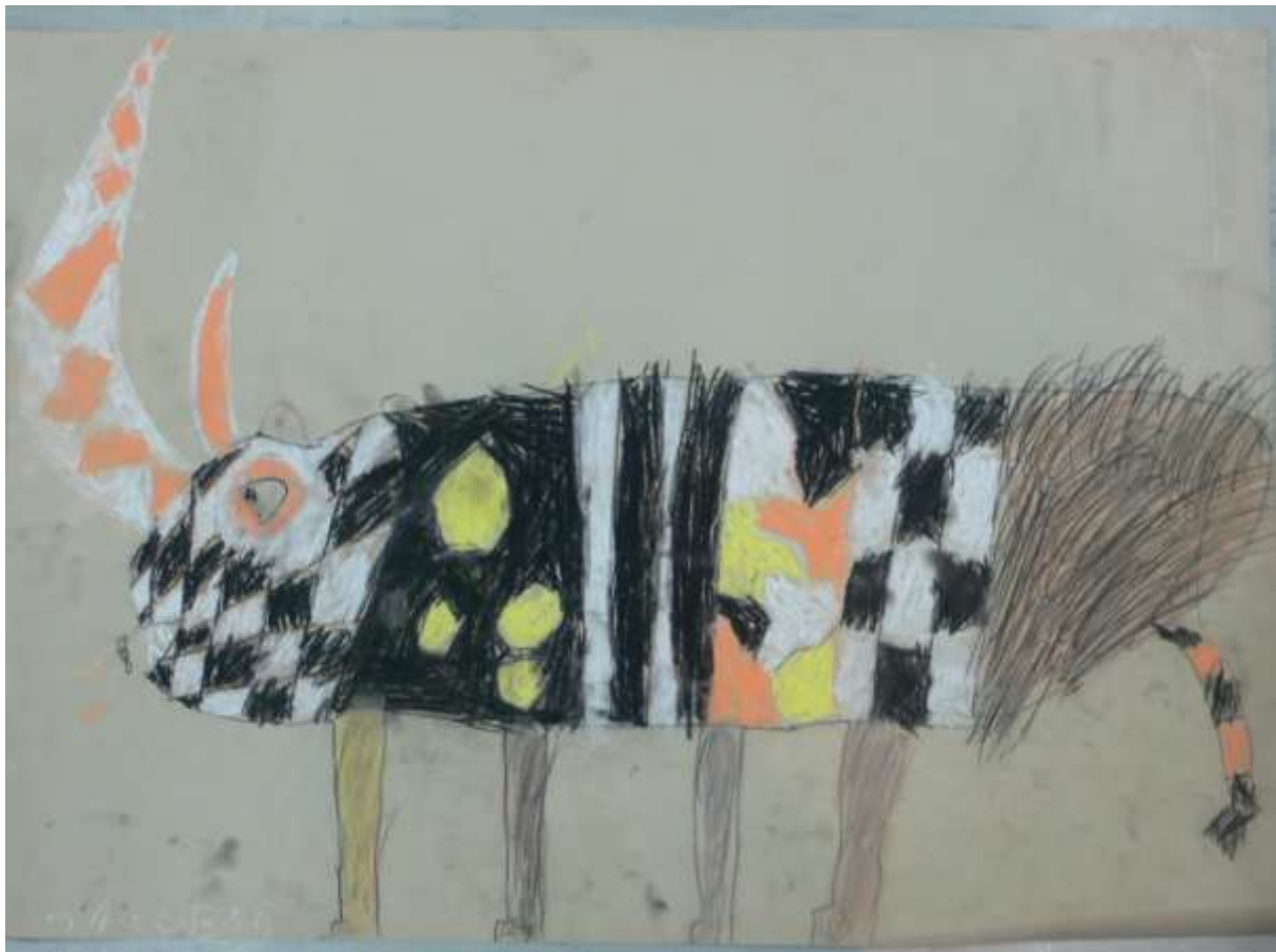
FELLNASHORN (KL. 5)