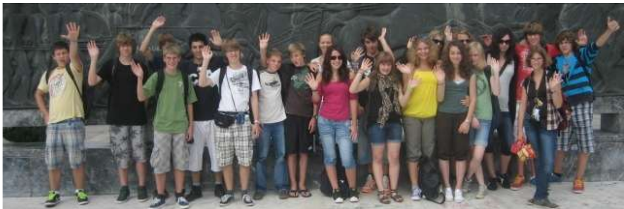
Vor dem Fries „Alexanderfeldzug“