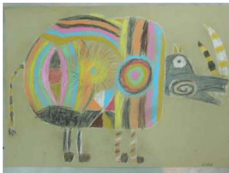
Fellnashorn (Kl. 5)