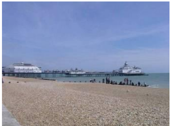
Das Pier in Eastbourne

Am nächsten Tag fuhren wir mit dem Bus in die Nähe der Klippen Eastbournes (Beachy Head). Von einem Hügel aus konnten wir eine wunderschöne Aussicht auf die Küste, das Meer und Eastbourne genießen. In gemächlichem Tempo wanderten wir hinunter zum Strand und schließlich zum Pier von Eastbourne. Dort konnten wir eine Stunde lang verweilen, bevor wir uns auf den Weg zur Sprachschule machten. Dort sollten wir die Möglichkeit bekommen, unser Englisch zu verbessern. Als erstes mussten wir einen Test schreiben, damit wir gemäß unserer Englischkenntnisse in Gruppen aufgeteilt werden konnten. Nach Unterrichtsende wurden wir vom Bus abgeholt und hatten den Rest des Abends bei den Gastfamilien zur freien Verfügung.