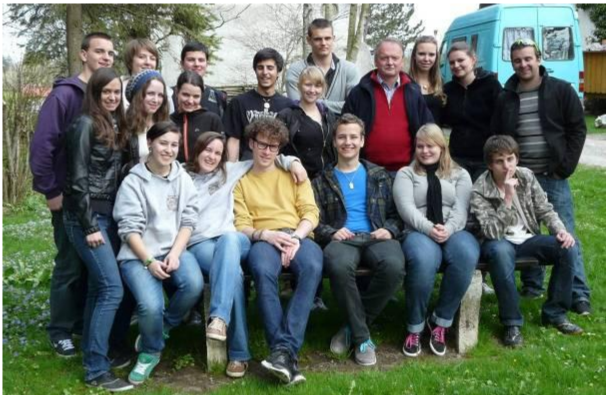
Viel Lärm um Nichts – Theater AG ungeschminkt