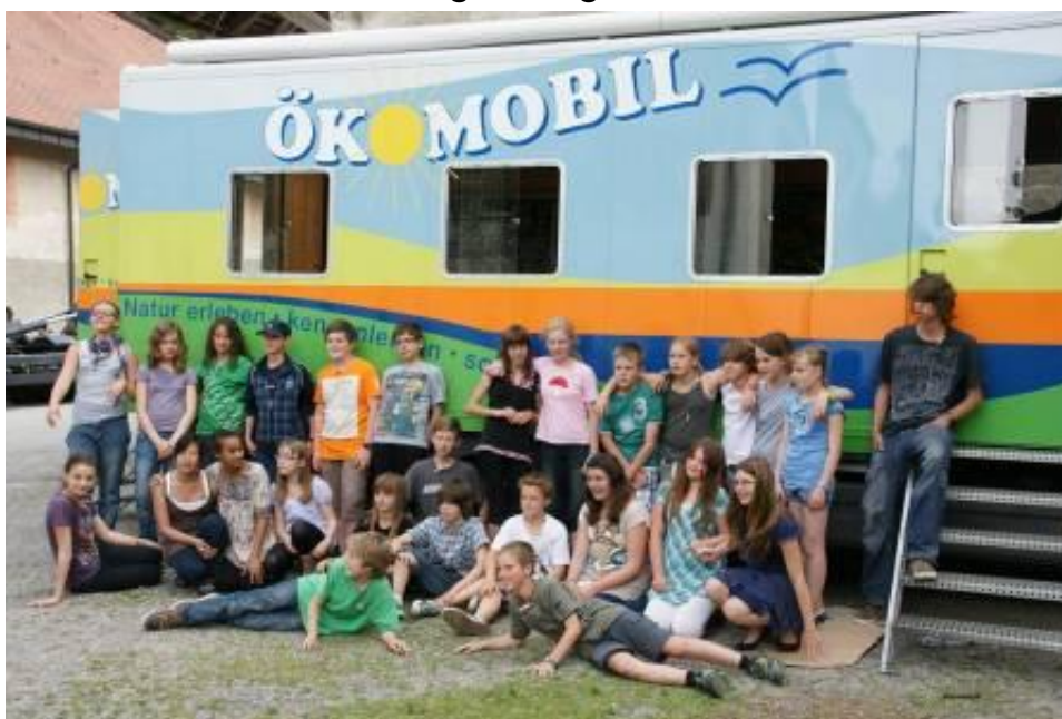
Die jungen Forscher der Klasse 6a vor dem Ökomobil

Das Ökomobil, ein "rollendes Klassenzimmer", das im Rahmen eines Projekts des Regierungspräsidiums Schulen und anderen Institutionen im Land zur Verfügung steht, hielt am Dienstag, dem 7.6., in der Nähe des Freibads in Weingarten. Trotz des für manche anstrengenden Anmarsches durch die Stadt waren alle Kinder dann mit Feuereifer dabei, als es darum ging, auf der benachbarten Wiese so viele verschiedene Tierarten mit Fangnetzen schonend einzufangen, um sie hinterher unter dem Mikroskop zu betrachten und– nach Möglichkeit – näher zu bestimmen. Bei über 30000 heimischen Insektenarten gar nicht so einfach! Die Ergebnisse durften die Jung-Biologen dann in dem mit modernster